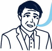
David PUJADAS Journaliste

On est dans un monde qui a des moyens techniques, des moyens d'ingénierie comme il n'en a jamais possédé auparavant, et on se dit " ce serait étrange qu'on n'arrive pas, quand même, à faire face à certains de ces phénomènes " !